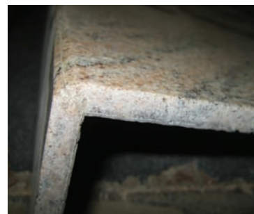
Trittstufe mit geklebter Vorderkante.

und bereits nach 20 Minuten begehbar. Zeit- und schmutzintensive Vorarbeiten wie Schleifen und Spachteln entfallen. Die Aufbauhöhe beträgt 9 - 12 mm, so dass in der Regel keine Probleme mit der Treppengeometrie entstehen. Bis zu 8 mm Höhendifferenz kann der Kleber ausgleichen, so dass sich